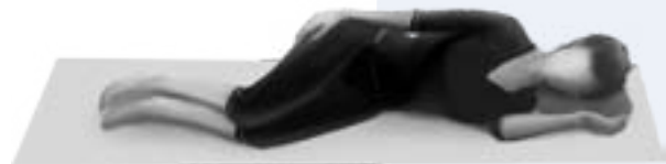
Illustrationer: Stefan Lindgren Josefsen

2. Lig på siden med bøjede ben knib sammen i bækkenbunden og fornem at endetarmen lukkes.